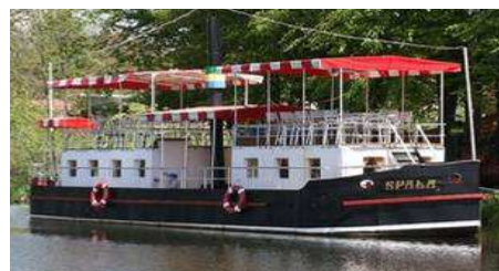
"Корабль" на Спальском озере