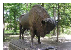
Заповедник зубров в Спале